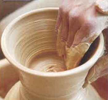
絵付け・ろくろ たたら・手びねり体験