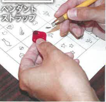
ペンダント ストラップ